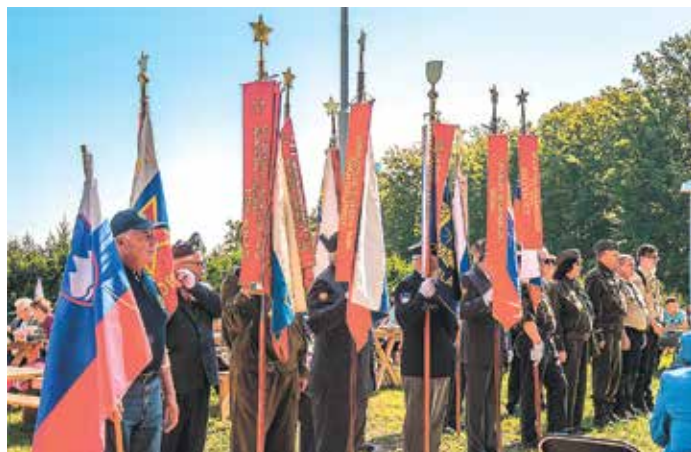
Zastava in prapori