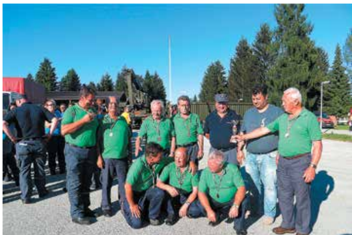
Starejši gasilci ob prejemu pokala za 3. mesto na regijskem tekmovanju.