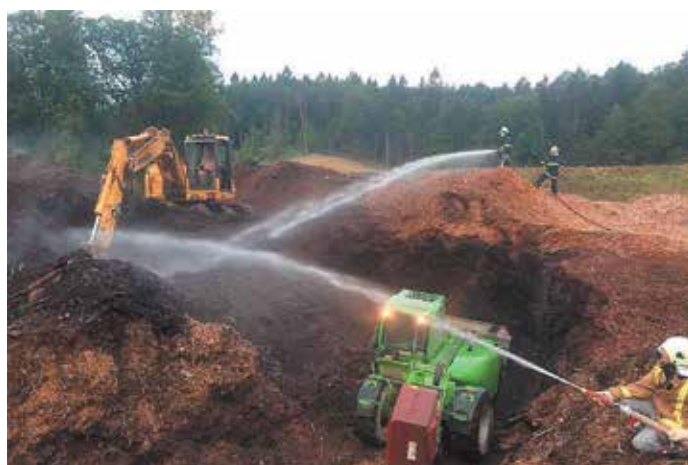
Gašenje požara na Puščavi

22. julij: udeležba na slovesnosti ob praznovanju 90. obletnice delovanja PGD Vrhtrebnje