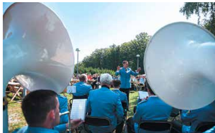
Občinski pihalni orkester Trebnje