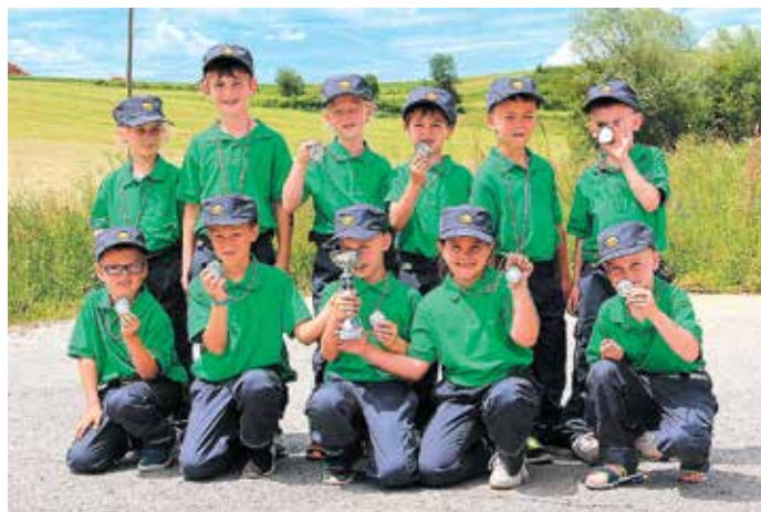
Pionirji s pokalom in medaljami za doseženo 2. mesto na tekmovanju GZ Trebnje.

..... Ko sem v peči, vsak me rad ima, v strehi – vse pred mano trepeta.