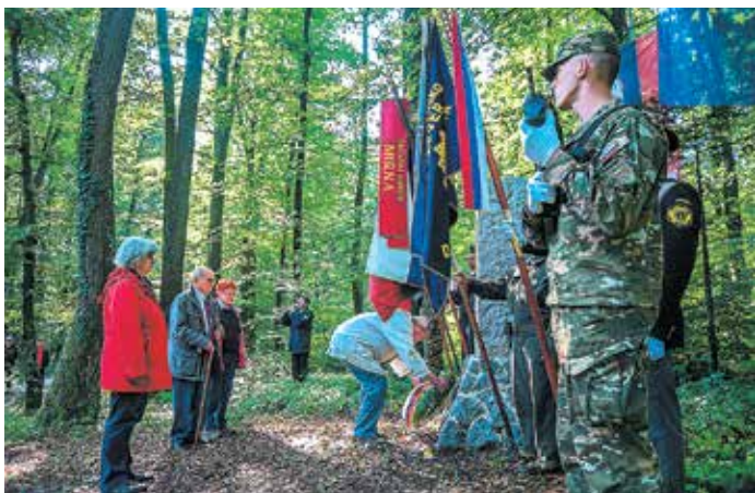
Polaganje venca pri spomeniku