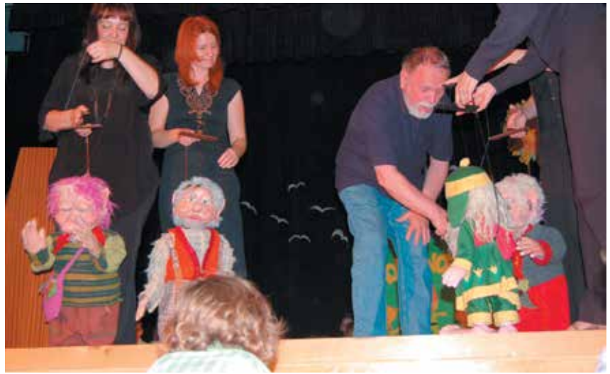
Poimenovanje Vrtca Mokronožci, junij 2008

Z idejami, znanjem in ustvarjalnostjo ali z odlomki svojih literarnih del