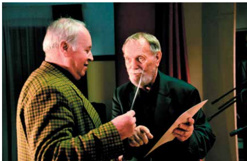
Lažinjada 2014 na Mirni.