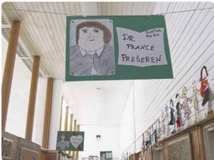
Kulturni kviz in likovno ustvarjanje ob Prešernovem dnevu