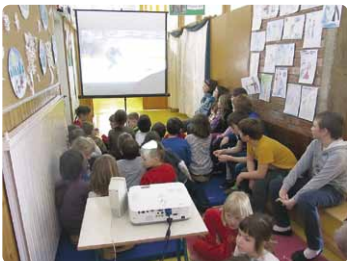
Zimske olimpijske igre Soči – Trebelno in pravo navijaško vzdušje

Letošnja zima nam je malce zagodla, saj nismo uspeli ujeti pravega trenutka za vragolije na snegu. Ampak zimo smo si popestrili kar sami ... Učenci in učiteljice s podružnice