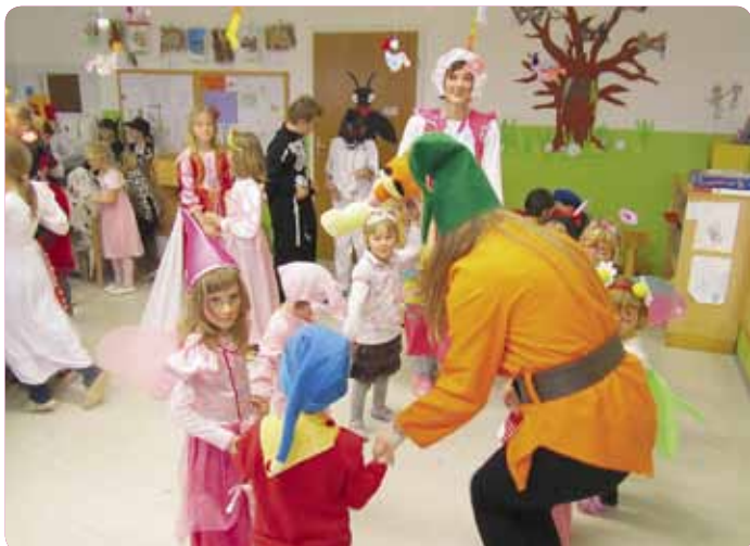
Na pustni torek so zavladale maskare vseh barv, velikosti in oblik